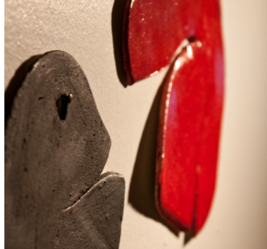
Stemming fyrir lífinu, 2010

Þótt þú takir flugið þá er ekki þar með sagt að allt gangi upp